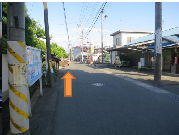
⑥進むと、右手に中野島公民館があります