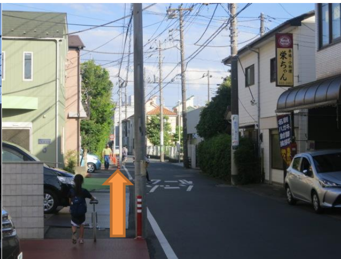
⑤交差点を曲がった道はこんな感じです 所要時間 ここまで約4~5分