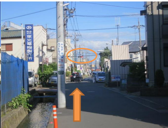
⑪信号が見えてきます