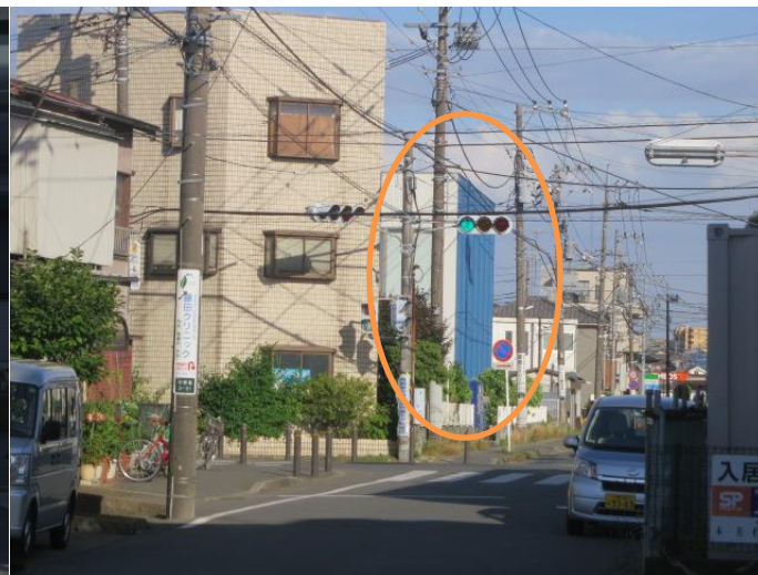
⑫さらに、青い壁が見えてきました