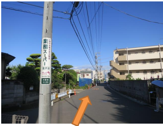
⑩業務スーパーの案内がある電柱の脇を通ると、