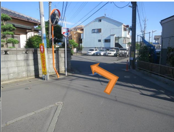
⑧この四差路は、真ん中の道へ進んでください