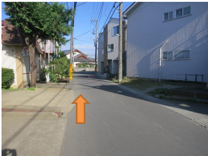
⑦そのまま道沿いに行きます